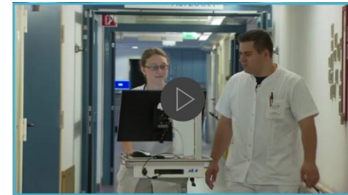
WL ID Center in den Krankenhäusern der Barmherzigen Brüder